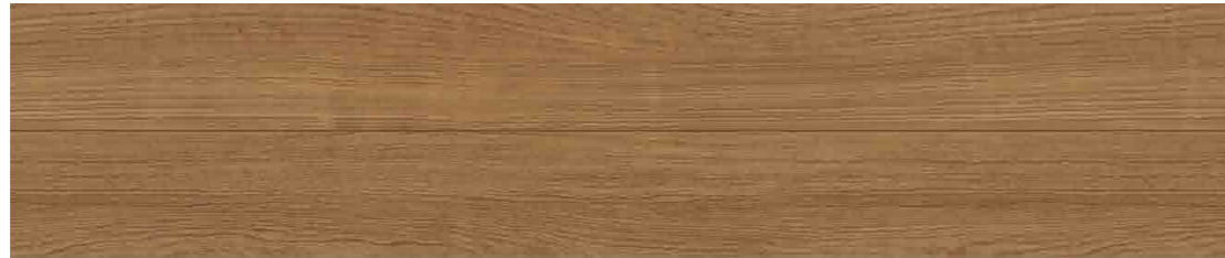
チェリーミディアム色 JC12S1-E1 ●303×1,818×12mm 6枚入