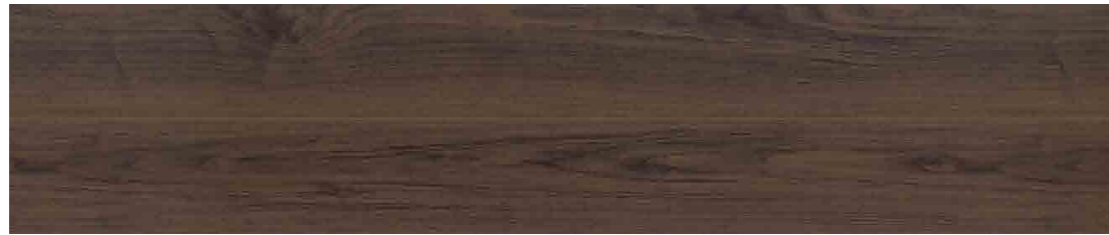
ウォールナットダーク色 JC12S1-D1 ●303×1,818×12mm 6枚入