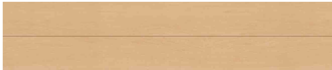
メイプルパール色 JC12S1-P1 ●303×1,818×12mm 6枚入