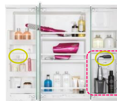
※写真は新LED照明3面鏡 幅900mmの収納例です。